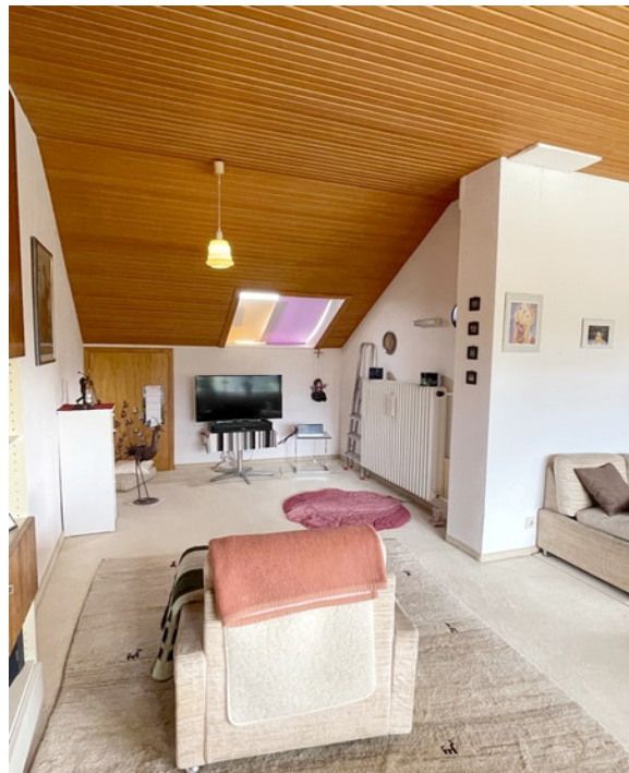
Blick in den Wohnbereich OG