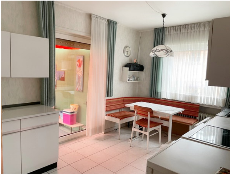
Küche mit Zugang in den Wintergarten