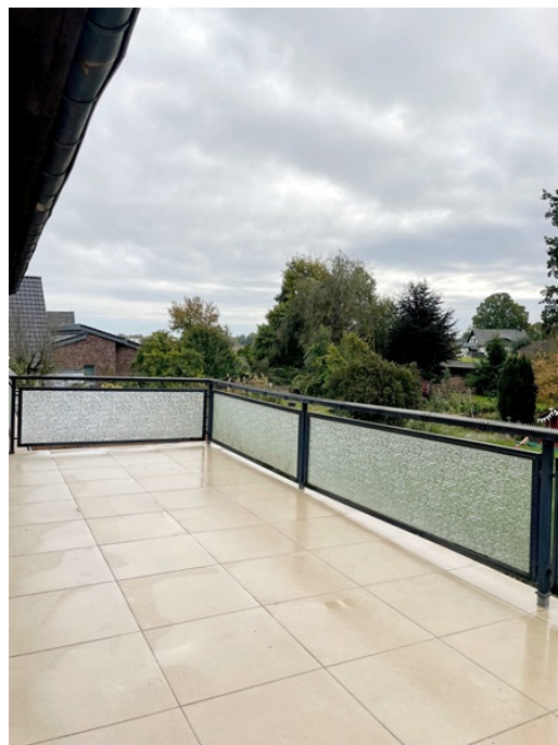
Terrasse im OG