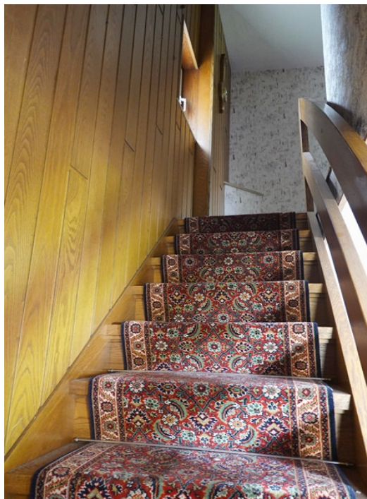
Treppe ins Obergeschoss