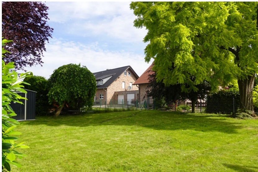
Blick aufs Grundstück