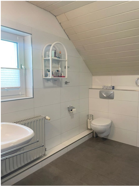
Bad mit großer Dusche