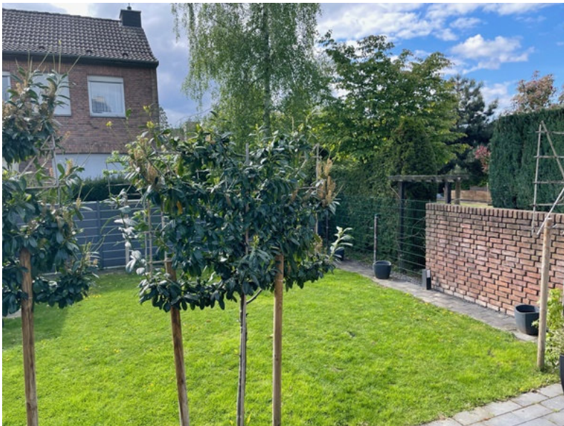
Blick in den Garten