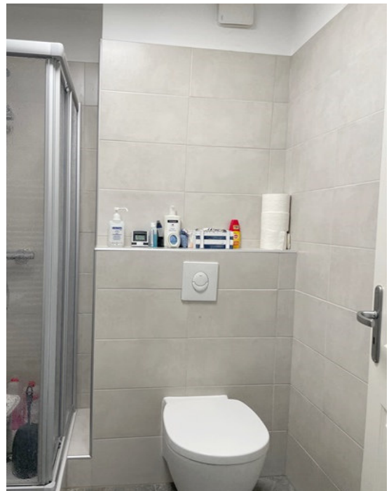
Gäste-WC mit Dusche