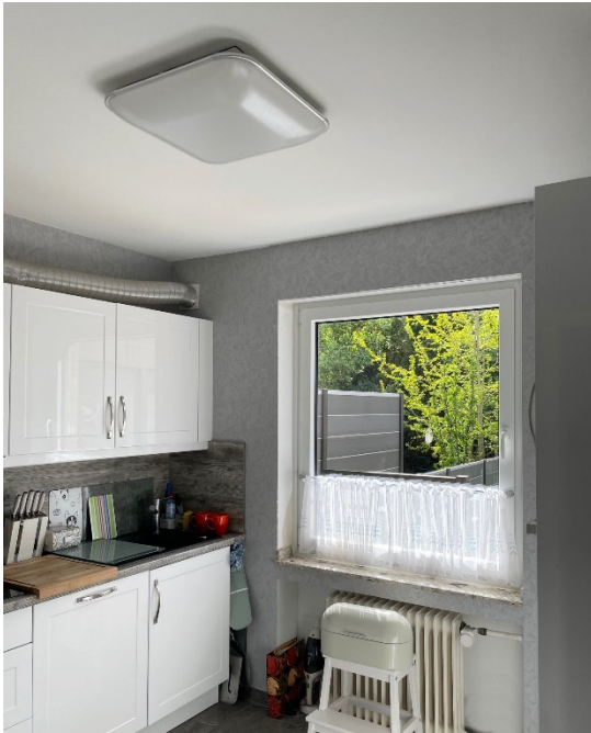
Küche (EBK Übernahme möglich)