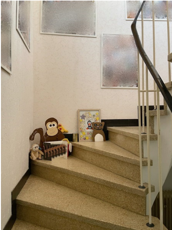
Treppe ins Obergeschoss